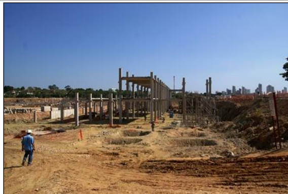
Vista da montagem da estrutura pré-fabricada