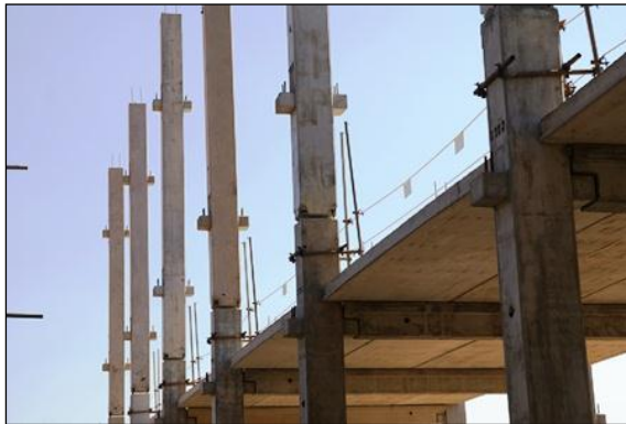
Montagem da estrutura pré-fabricada das arquibancadas