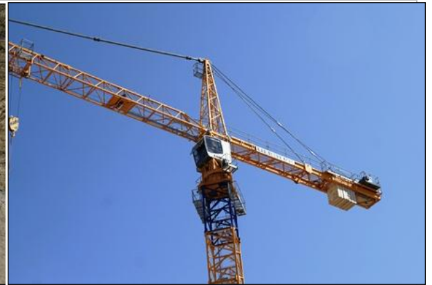
Parte superior da grua utilizada para içar a estrutura pré-fabricada das arquibancadas.