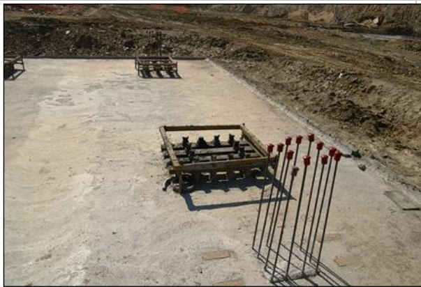
Vista de sapata com insertes para fixação de estrutura metálica