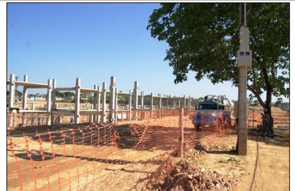
Vista da montagem da estrutura pré-fabricada