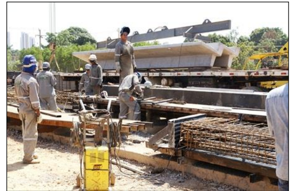
Pátio de pré-fabricação da estrutura de concreto