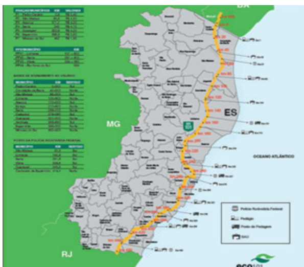
Figura 1 - Concessão da BR-101 no Espírito Santo

A Comissão de Solução Consensual (CSC) discutiu o contrato de concessão da BR-101 no estado do Espírito Santo, assinado com a empresa ECO 101, em 2013 (cf. figura 1). Em 2022, a concessionária entrou com pedido de relicitação, um processo de saída amigável da empresa (Lei 13.448/2017).