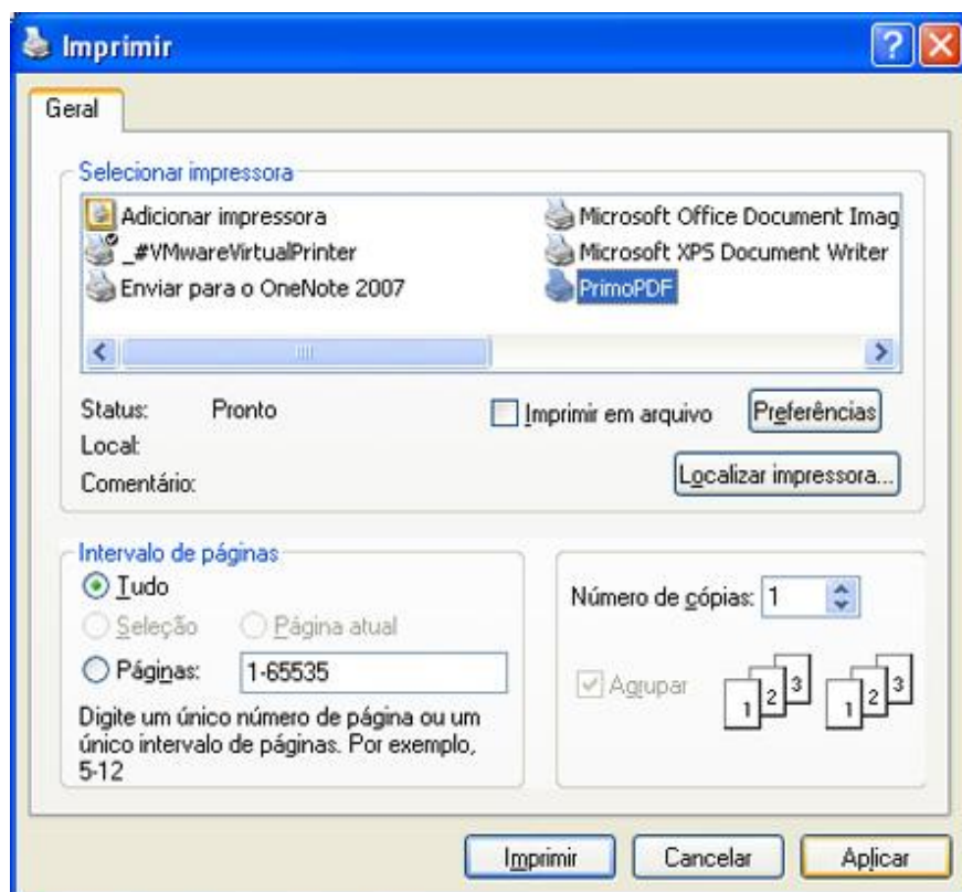
Tela 3: Escolha da impressora PDF