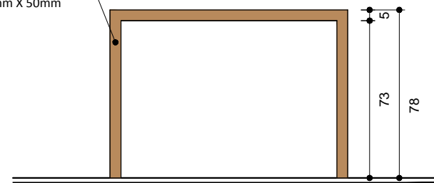
VISTA 2 ESC. 1/25