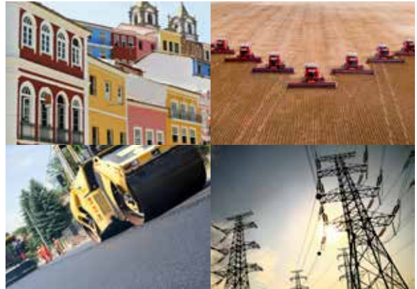
Processo de planejamento do FNE

Foram R$ 27,7 bilhões de reais, alusivos à Programação Anual do FNE-BNB no exercício de 2017.