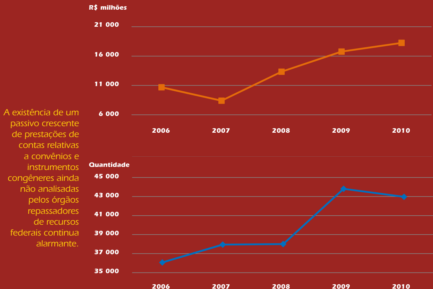
Gráfico 2. Prestações de Contas não analisadas – Exercícios de 2006 a 2010

Em 2010, houve uma pequena redução da quantidade de prestações de contas não analisadas em relação a 2009 (2%), contudo, o valor dos recursos dessas prestações é 13% superior ao verificado no ano anterior.